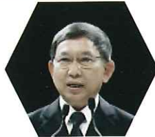
H.E. ACM Dr. Prajin Juntong Deputy Prime Minister