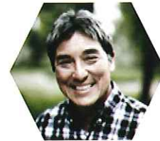
Guy Kawasaki Marketing Specialist, Author and Silicon Valley Venture Capitalist