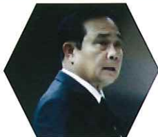
H.E. General Prayut Chan-o-cha Prime Minister