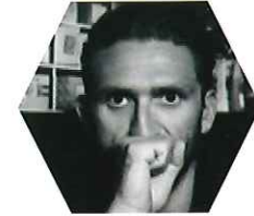
Casey Neistat Co-founder, Beme