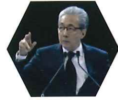
H.E. Dr. Somkid Jatusripitak Deputy Prime Minister