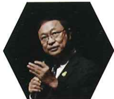
H.E. Dr. Pichet Durongkaveroj Minister of Digital Economy and Society